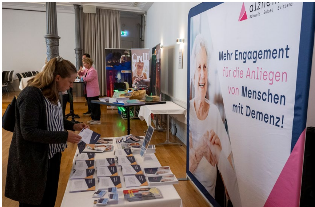
Stand pendant la conférence